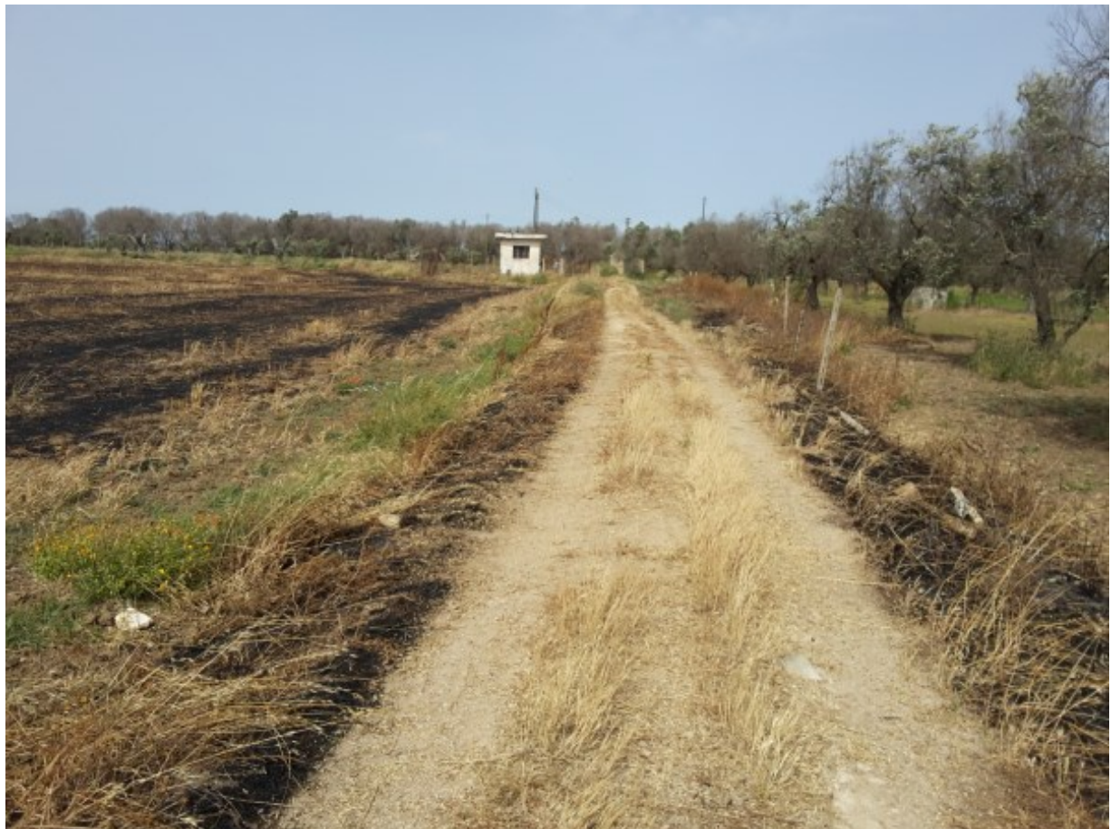
La strada vicinale Valentini, stradone in terra battuta, presente sul lato nord.