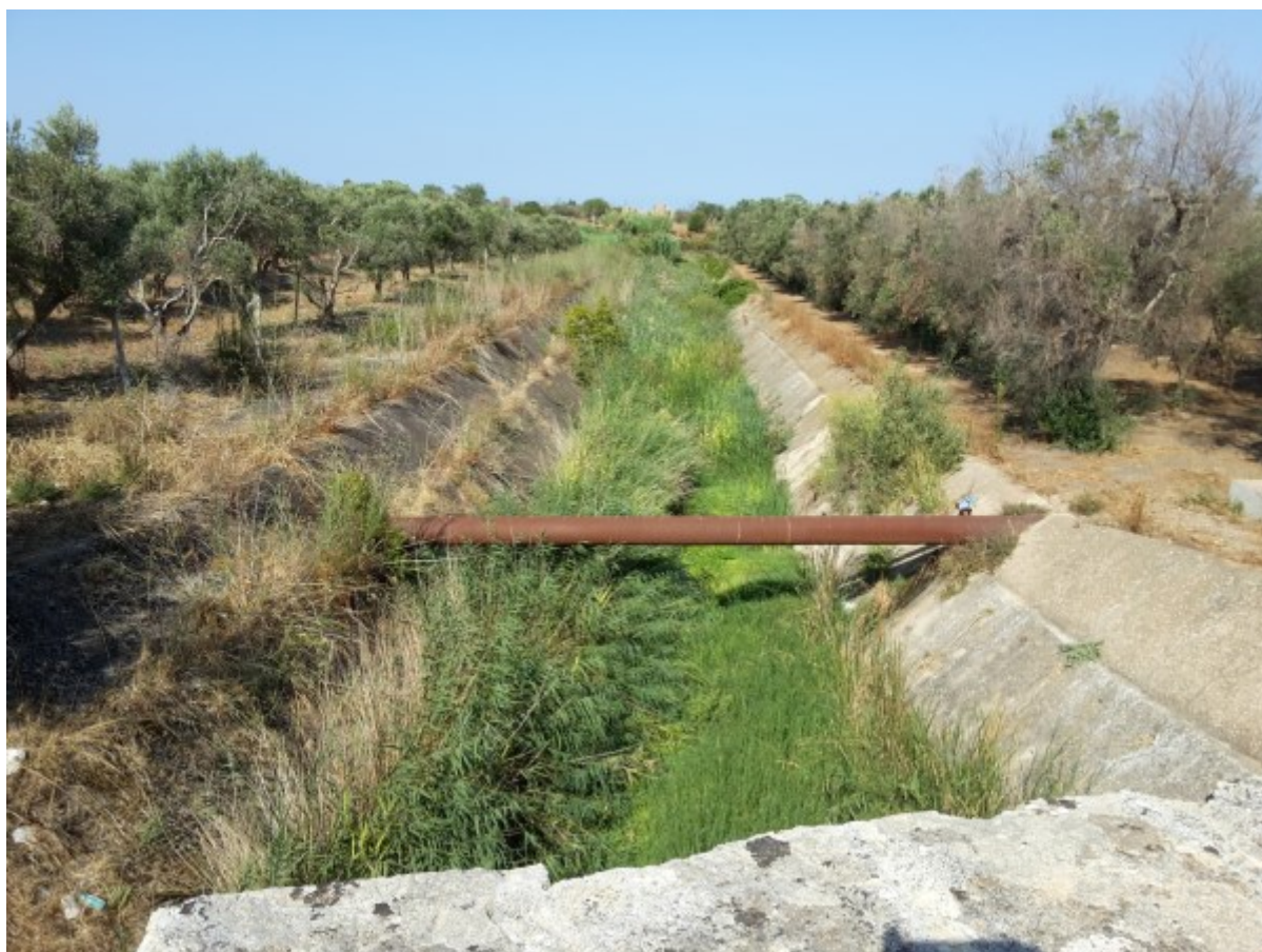
Il Fosso dei Samari presente circa 1 km a sud dal sito di progetto.