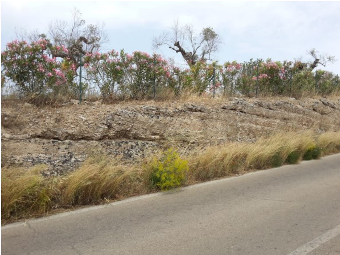
Le calcareniti grossolane, ben cementate, porose, di colore variabile dal giallino all'avana, note localmente col nome di “carparo”, affioranti con modesti spessori nell’area di interesse (“Depositi Marini Terrazzati”).