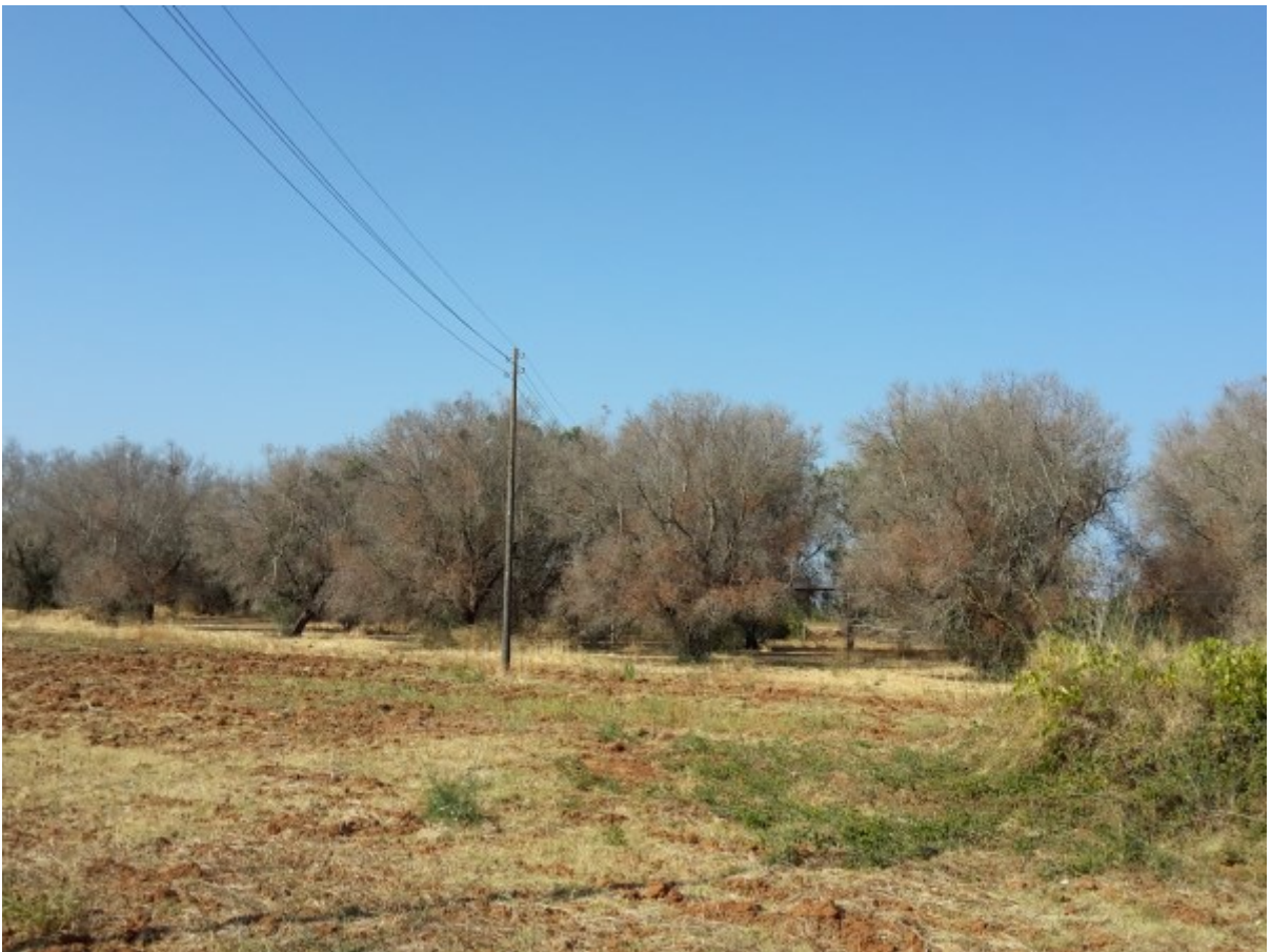
Oliveto attaccato dal patogeno Xylella Fastidiosa.