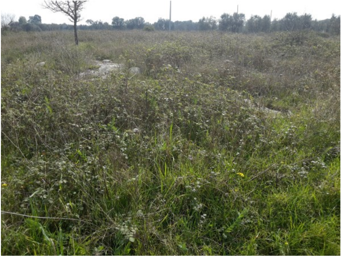
Specie erbacee ruderali poliannuali.