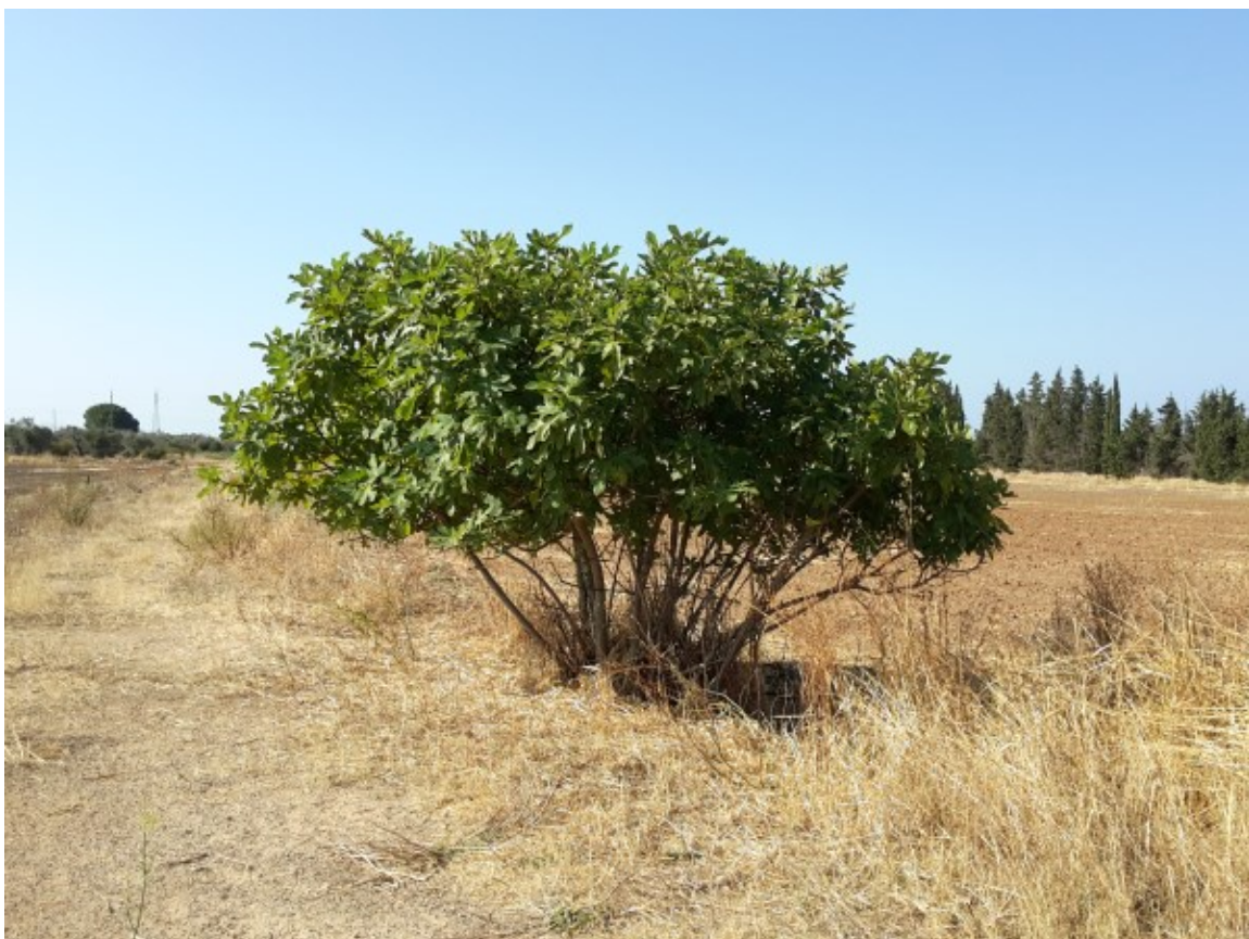
Noce e fico sono le uniche essenze arboree presenti nel sito in esame.