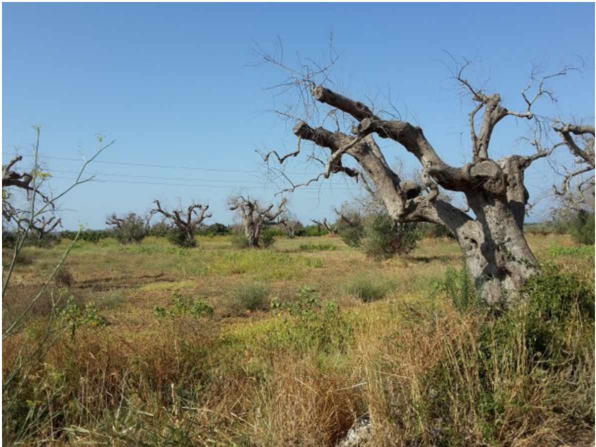
Oliveto secolare completamente disseccato.