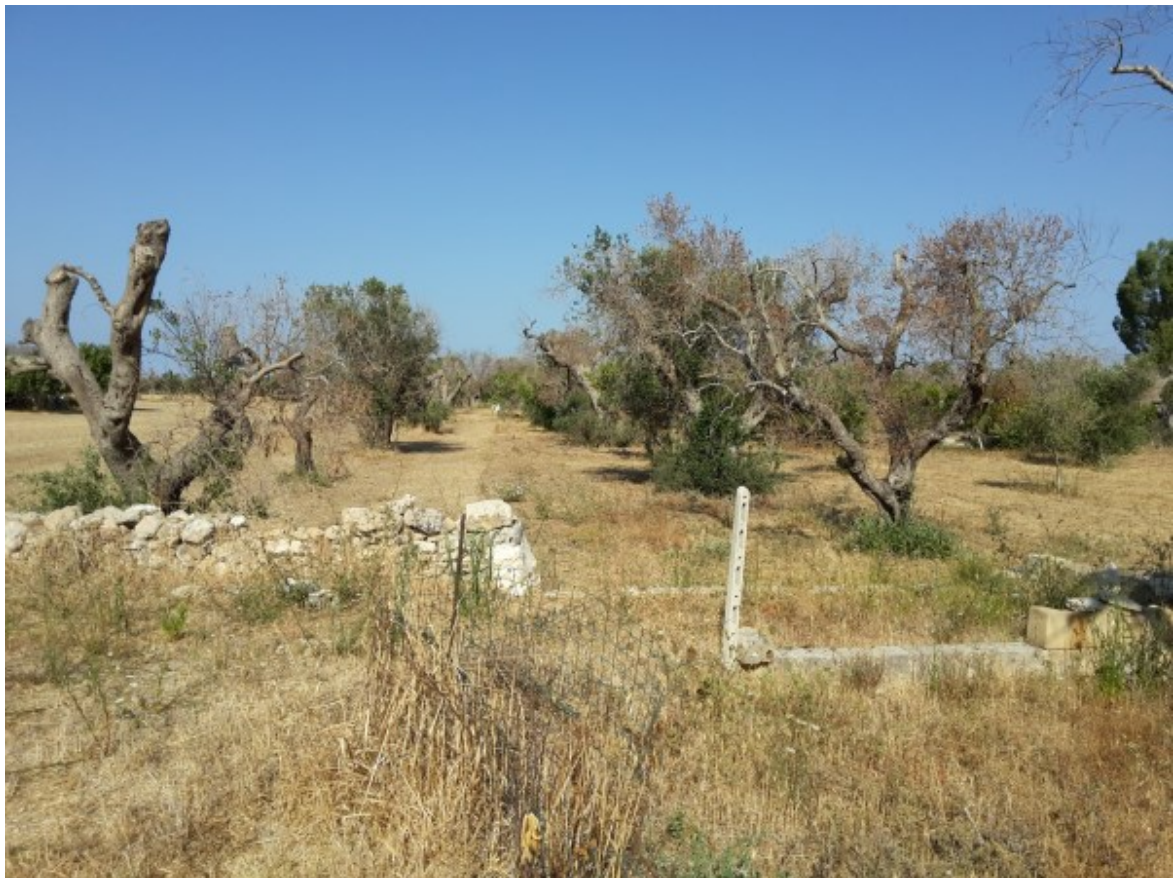
come foto precedente