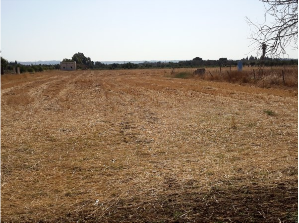
Vasta superficie a seminativo nelle vicinanze dell'area di progetto.