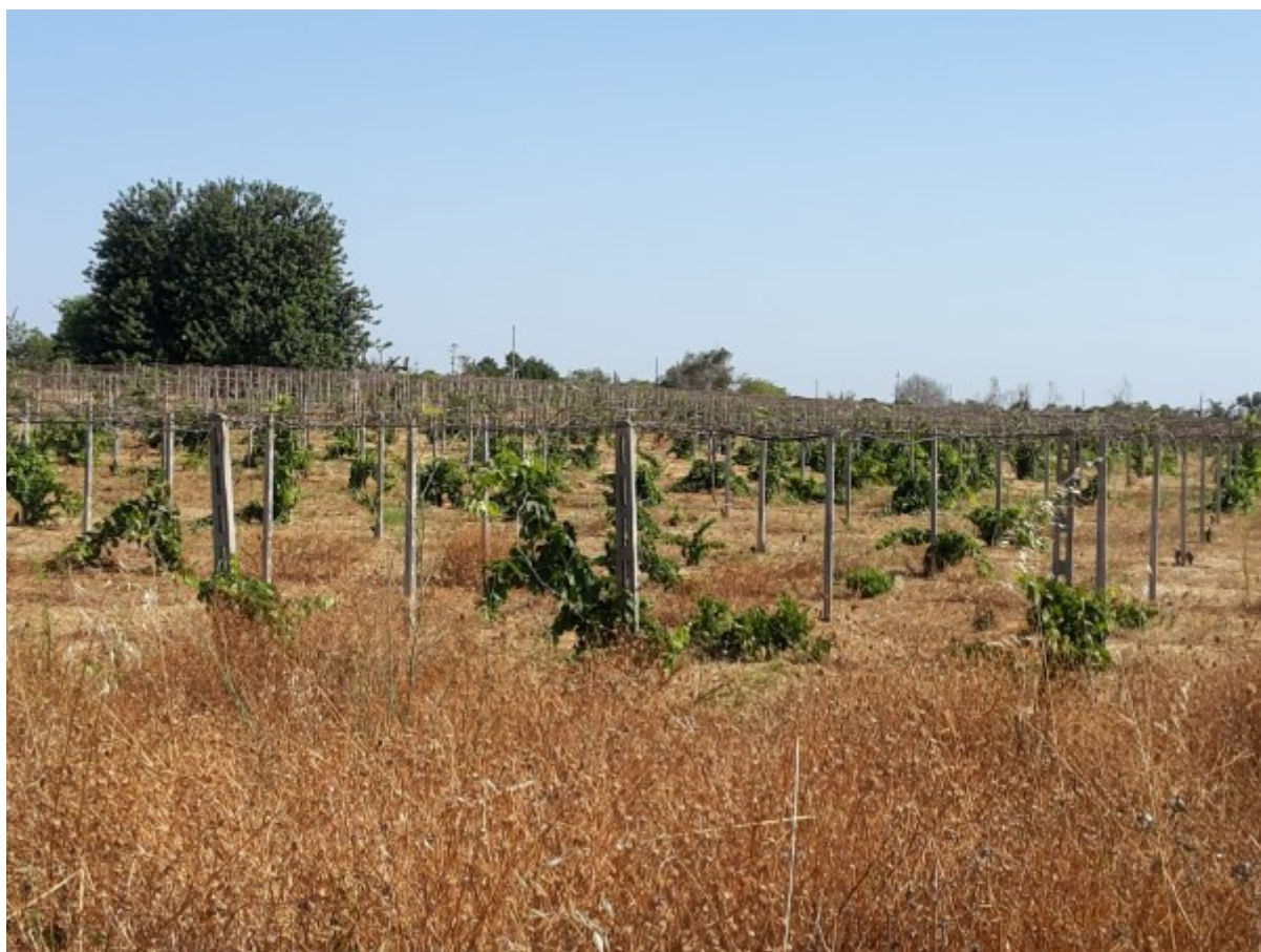
Superficie a vigneto.