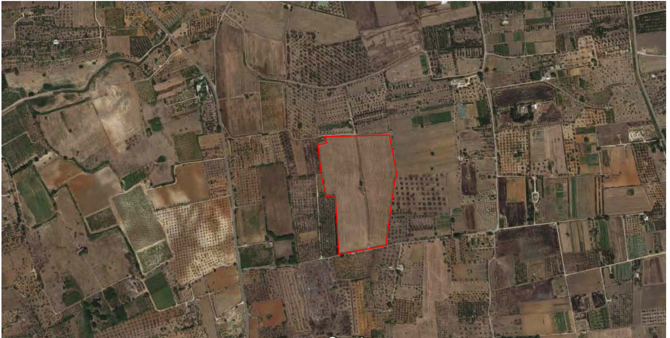
Ripresa satellitare dell'area di progetto