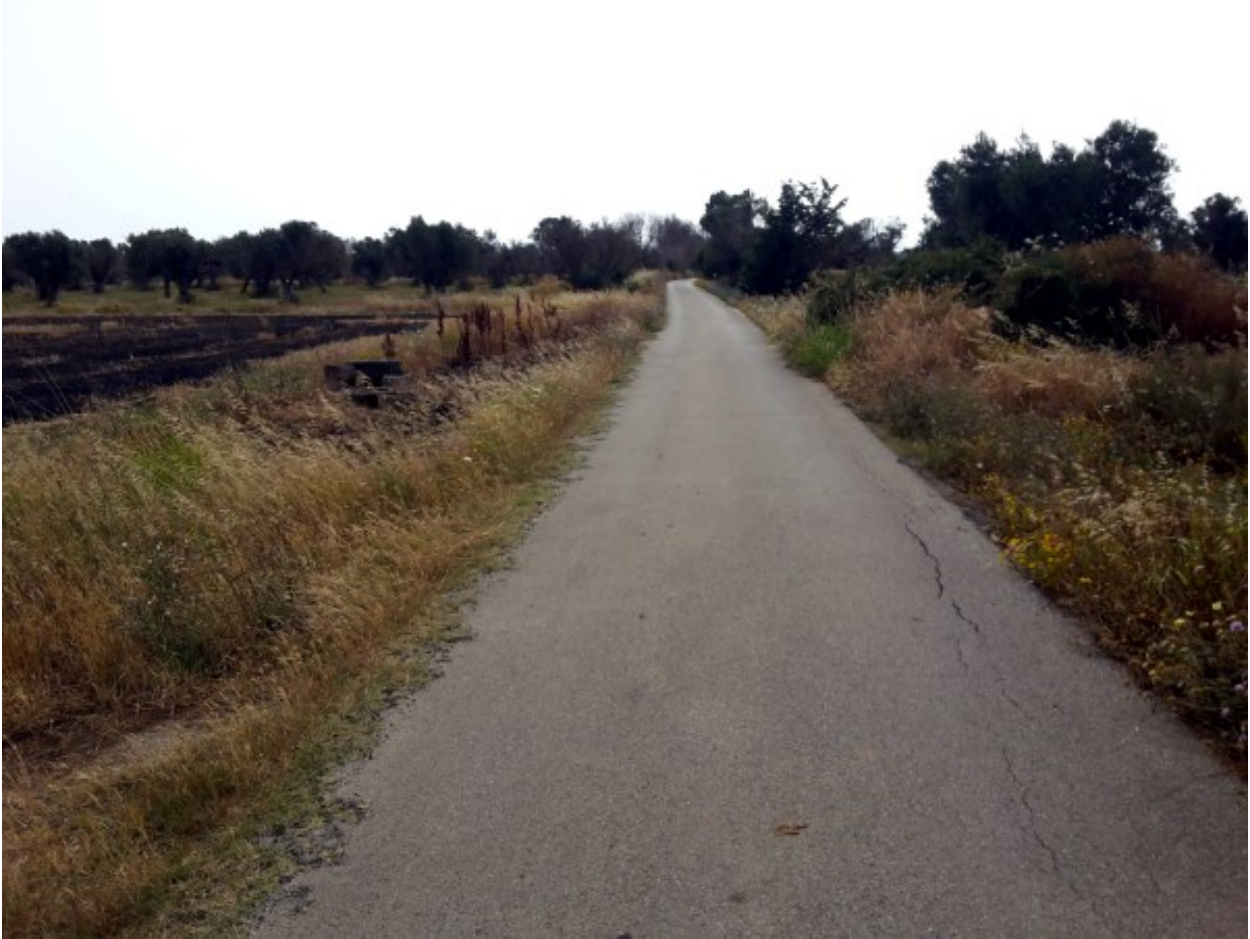
La strada vicinale Dattilo fornisce l'accesso all'area di progetto