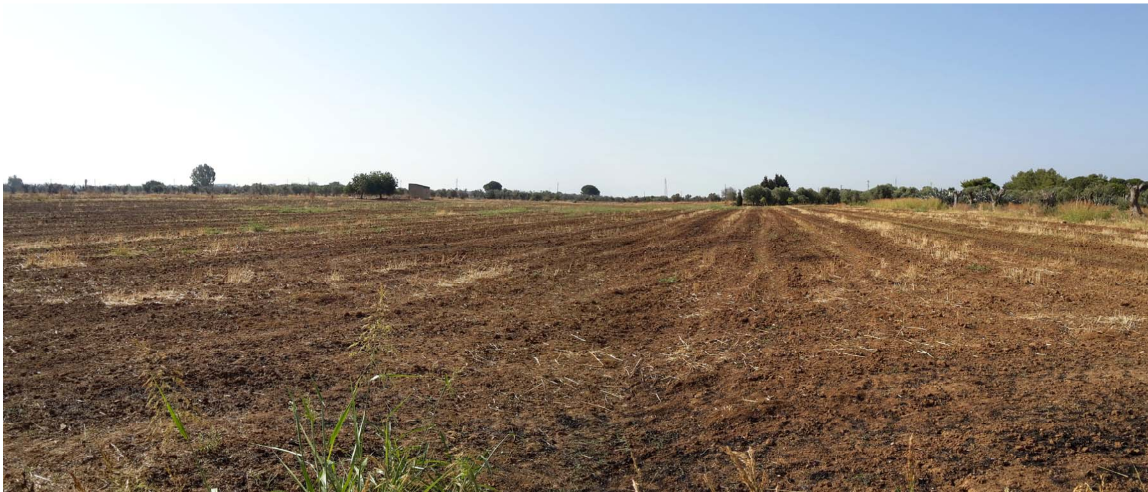
Visione generale dell'area di cava di progetto