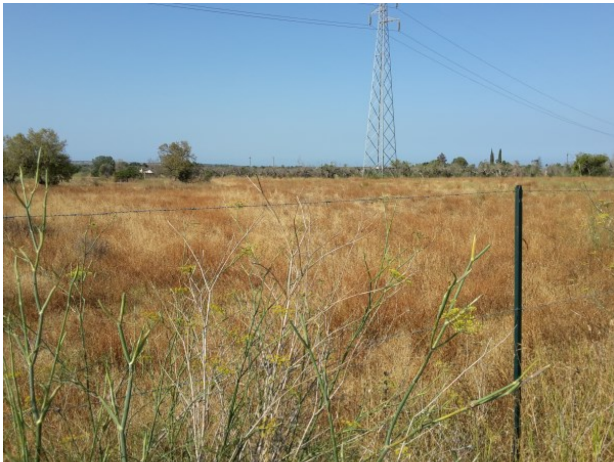
Superficie lasciata incolta.