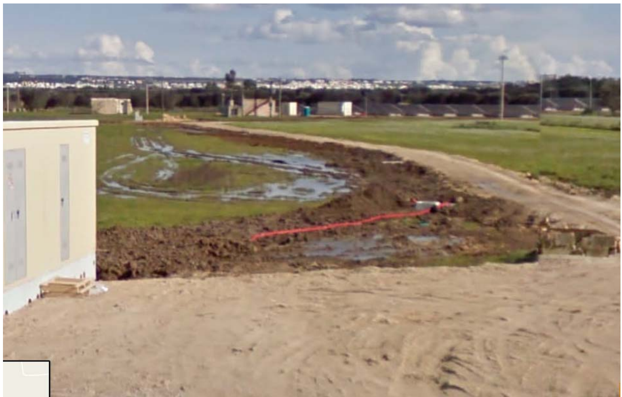
Impianto fotovoltaico in campo