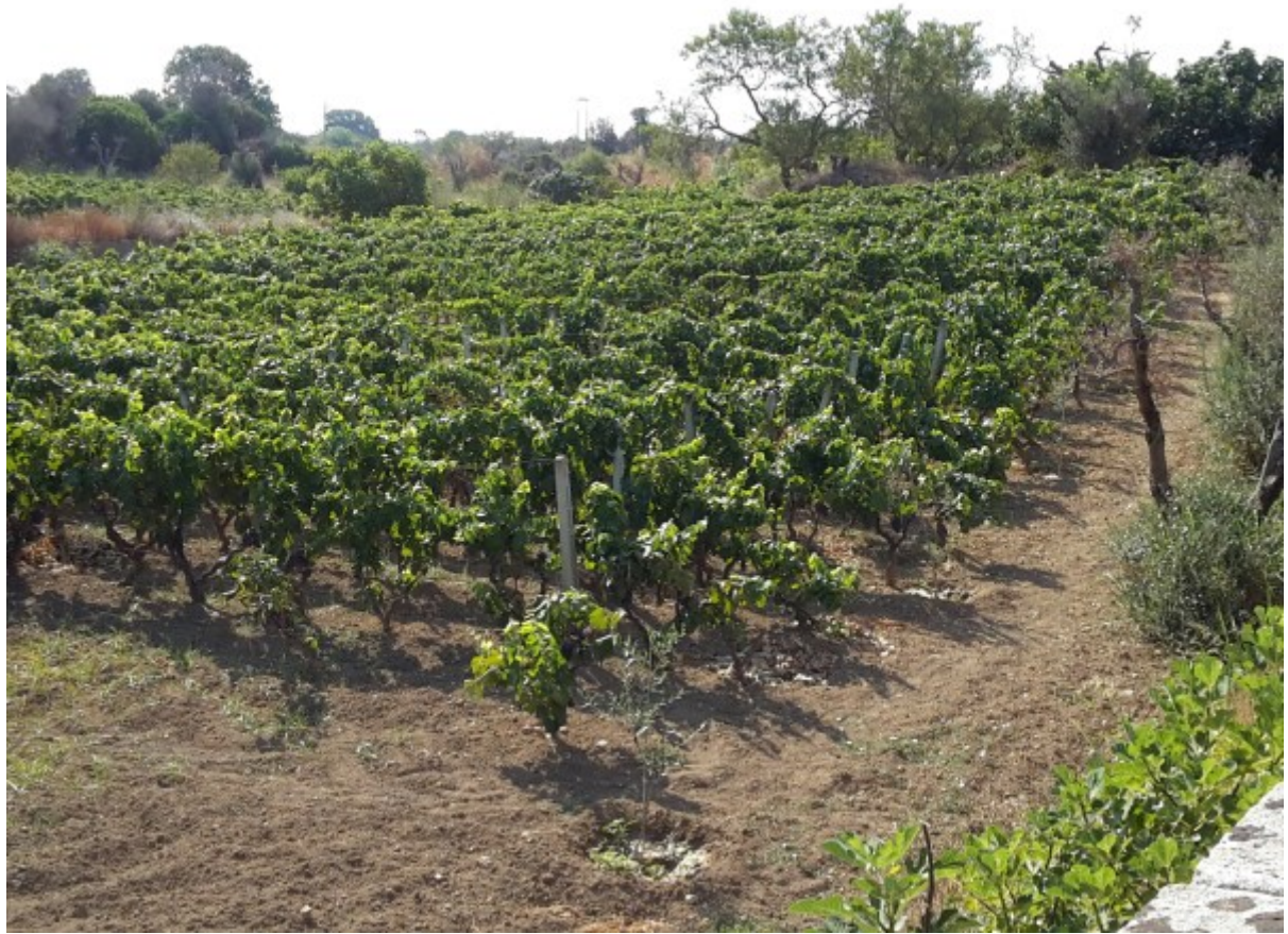
come foto precedente.