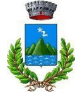
Città di Roseto degli Abruzzi