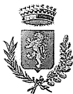
Comune di Bellante