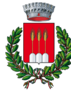
Comune di Morro d'Oro