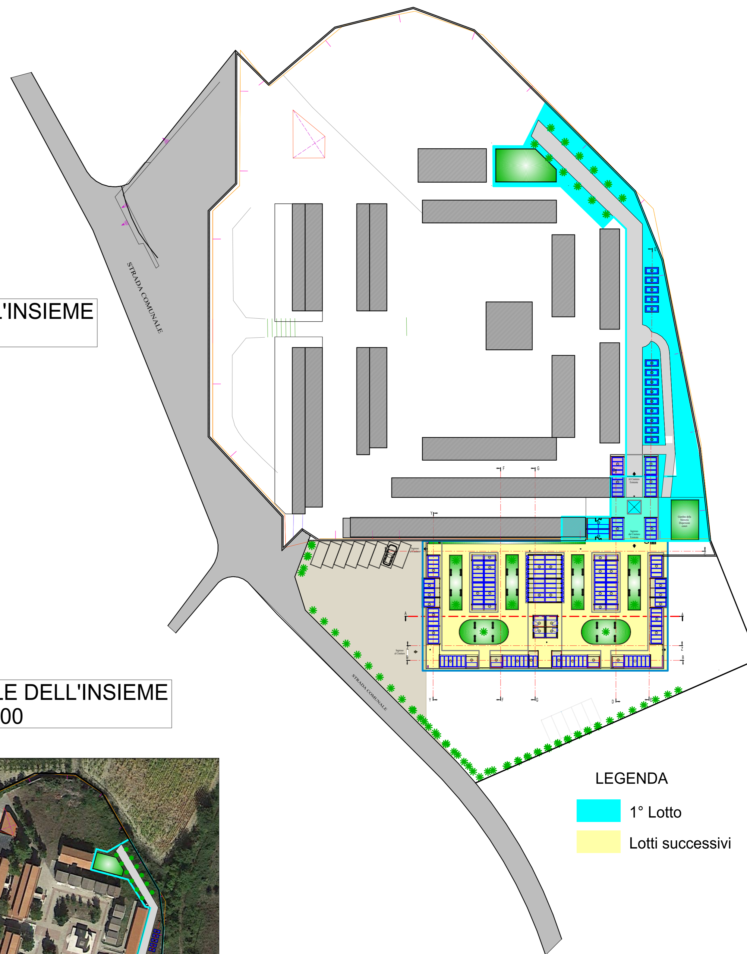
PLANIMETRIA GENERALE DELL'INSIEME Scala 1:500