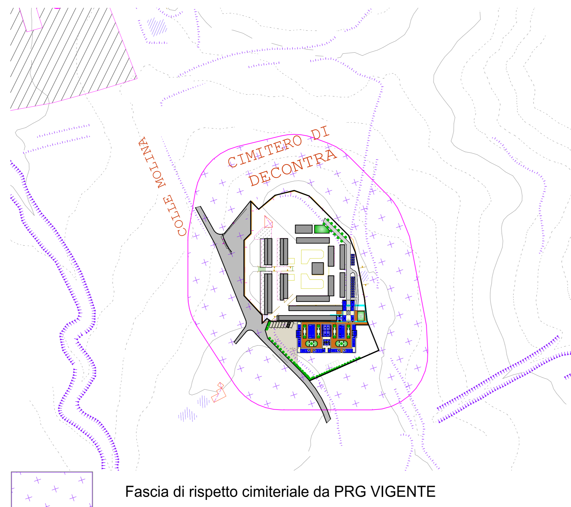
STRALCIO P.R.G. VIGENTE Scala 1:2000

Fascia di rispetto cimiteriale da PRG VIGENTE