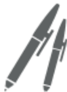
PENNE (nel secco residuo)