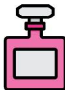
BOCCETTE PER PROFUMO