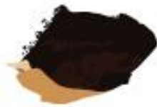
FONDI DI CAFFÈ