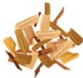
TRUCIOLI DI LEGNO