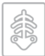
RADIOGRAFIE (nel secco residuo)