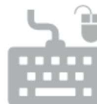
TASTIERA E MOUSE (RAEE)