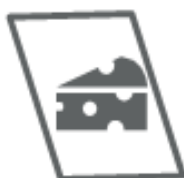
CARTA OLEATA (nel secco residuo)