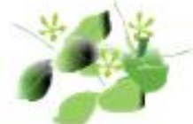
FIORI RECISI O APPASSITI