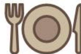
STOVIGLIE COMPUS T ABILI