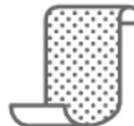
CARTA VETRATA (nel secco residuo)