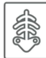
RADIOGRAFIE (nel secco residuo)