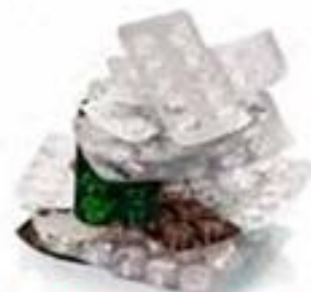
BLISTER PRIMI MEDICINE