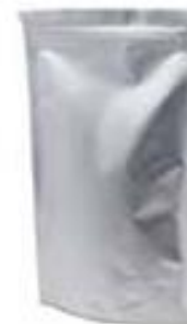
SACCHETTI IN ALLUMINIO