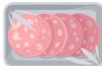
VASCHE TTE AFFETTATI