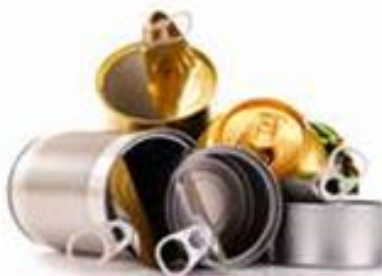
SCATOLETTE DEL TONNO