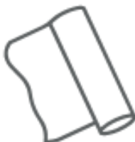
CARTA STAGNOLA (nei metalli)