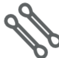
COTTON FIOC (nel secco residuo)