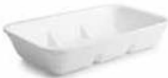
VASCHE TTE POLISTIROLO