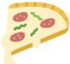
AVANZI DI CARNE E PESCE, SALUMI E FORMAGGI