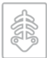
RADIOGRAFIE (nel secco residuo)