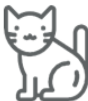
LETTIERE SINTETICHE (nel secco residuo)