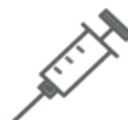
SIRINGHE (nel secco residuo)