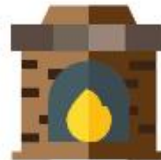
CENERI SPENTE DI CAMINETTI