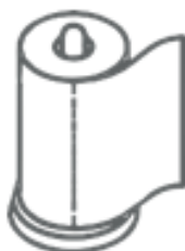
CARTA DA CUCINA (nel secco residuo)