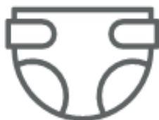
PANNOLINI (nel secco residuo)