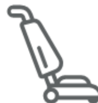
SACCHETTI ASPIRAPOLVERE (nel secco residuo)