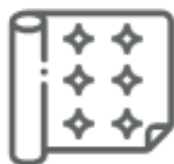
CARTA DA PARATI (nel secco residuo)