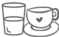
OGGETTI IN CERAMICA/VETRO (nel secco residuo)