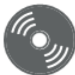
CD E DVD (nel secco residuo)