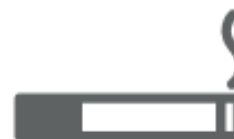
MOZZICONI (nel secco residuo)