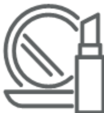
COSMETICI (nel secco residuo)