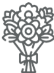
FIORI FINTI (nel secco residuo)