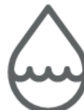
LIQUIDI DI OGNI TIPO