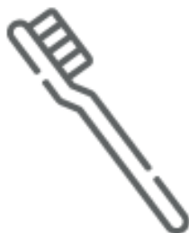
SPAZZOLINO (nel secco residuo)