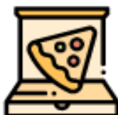
CARTONE DELLA PIZZA PULITO