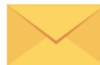
BUSTA DI CARTA