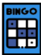
GRATTA E VINCI