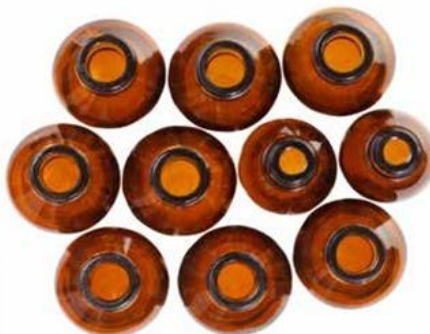
FLACONI PER ALIMENTI