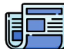
GIORNALI E RIVISTE