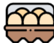
CARTONE DELLE UOVA