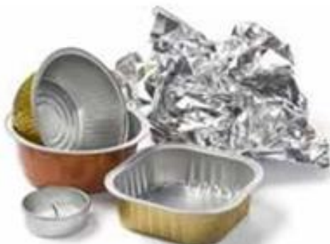
VASCHEE IN ALLUMINIO