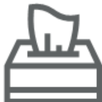
FAZZOLETTI PER IL NASO E CARTA ASSORBENTE (nel secco residuo)