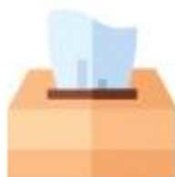
CARTA NON PATINATA, FAZZOLETTI E TOVAGLIOLI SPORCHI SOLO DI RESIDUI ORGANICI