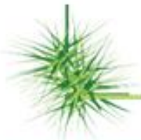
POTATURE DI PIANTE