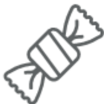
CARTA DELLE CARMELLE (nella plastica)