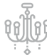
LAMPADARIO IN CRISTALLO (ingombranti)