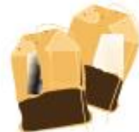
BUSTINE DI TÈ