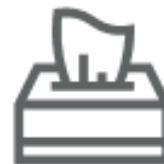
FAZZOLETTI E CARTA ASSORBENTE (nel secco residuo)