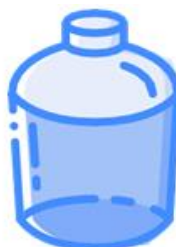
DAMIGIANA (senza involucro esterno)