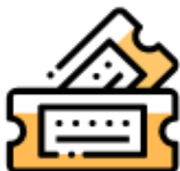
BIGLIETTI DEL TRENO