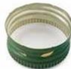
TAPPI IN METALLO