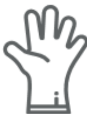
GUANTI IN GOMMA (nel secco residuo)