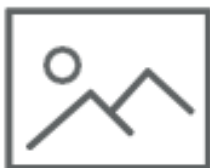
FOTOGRAFIE (nel secco residuo)