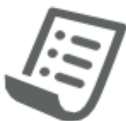
SCONTRINI (nel secco residuo)