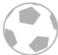
PALLONE (nel secco residuo)