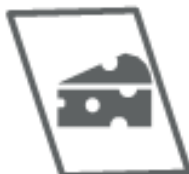
CARTA OLEATA (nel secco residuo)