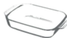
PIROFILE (nel secco residuo)