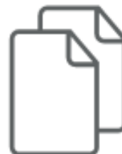
CARTA COPIATIVA (nel secco residuo)