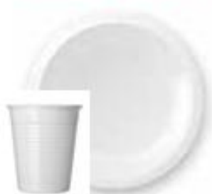
PIATTI E BICCHIERI MONOUSO