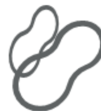
ELASTICI (nel secco residuo)