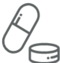
MEDICINALI SCADUTI (nei medicinali)