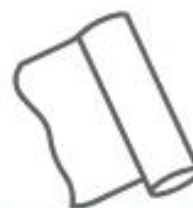
FOGLI DI ALLUMINIO