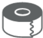
CARTA GOMMAT (nel secco residuo)