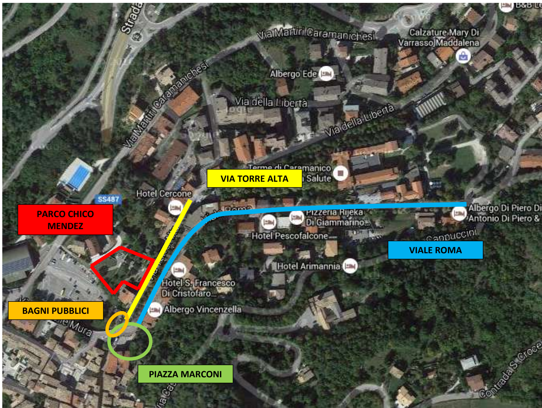
ALLEGATO 2 - AREE VERDI