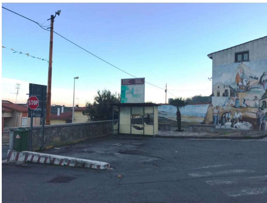
Vista Largo-Piazza lungo la Via Vittorio Emanuele

Sono previsti inoltre interventi volti all’ammodernamento degli arredi urbani lungo le strade dell’abitato con la fornitura e posa in opera di panchine, cestini per i rifiuti e di due nuove pensiline per l’attesa dei Bus.