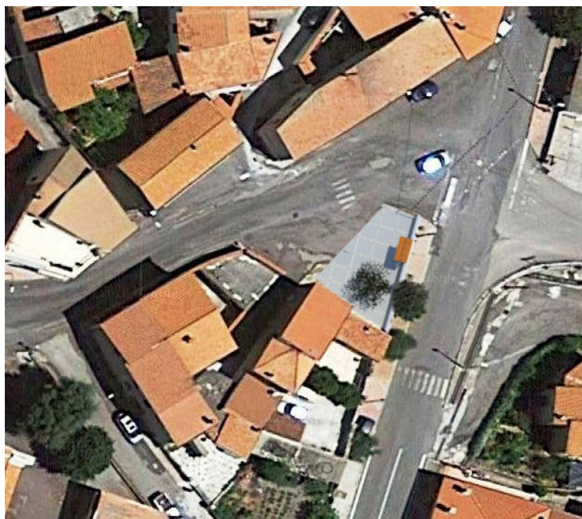
Simulazione intervento della Piazza lungo la Via Vittorio Emanuele