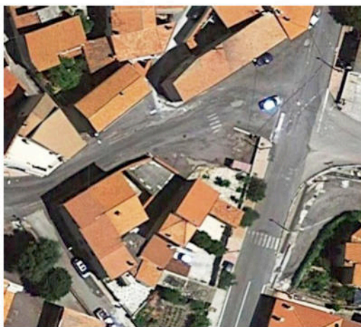
Vista aerea della Piazza lungo la Via Vittorio Emanuele

PROGETTO ESECUTIVO - Relazione illustrativa e tecnico-economica