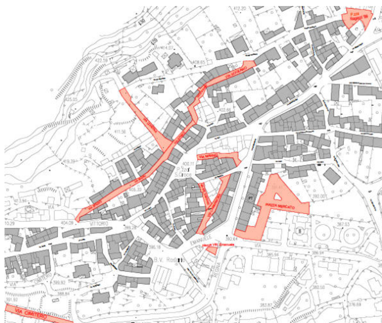
Planimetria generale dell'intervento

Il progetto riguarda il rifacimento dell'asfalto di alcune strade del Centro abitato di Bottidda