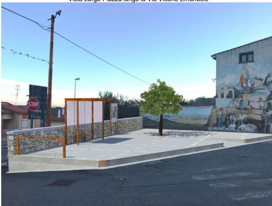
Simulazione intervento della Piazza lungo la Via Vittorio Emanuele