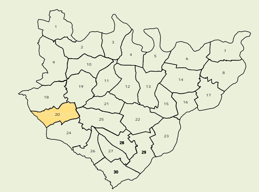
QUADRO D'UNIONE DEI FOGLI

progetto : Ufficio Tecnico Comunale Ing. Giustino DI GIACOMO geom. Lorenzo SIGISMONDO p.a. Costantino PIERFELICE ottobre 2008 SCALA 1:2000 Tav. 20 RESTITUZIONE PER FOGLIO DI MAPPA