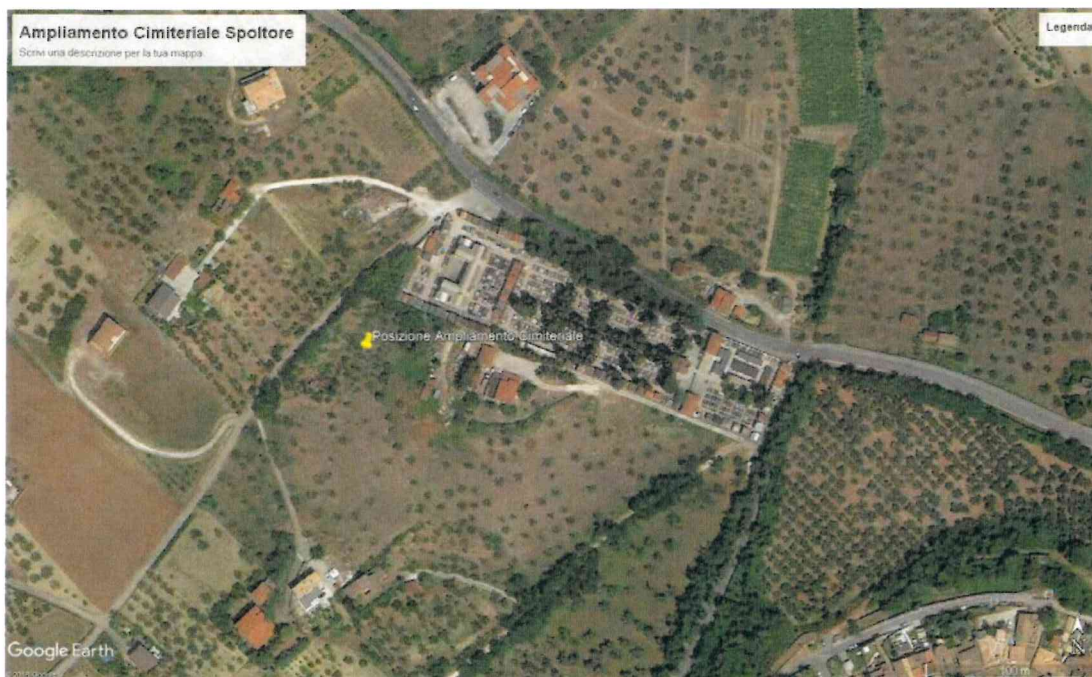
Vista aerea: Individuazione area cimiteriale esistente e posizionamento dell'ampliamento previsto

L'area ove è stato ipotizzato l'ampliamento cimiteriale, è posta a margine del Cimitero Comunale esistente, rispetto al quale viene a configurarsi come una soluzione che avrà una moderata incidenza sulle caratteristiche ambientali e paesaggistiche dei luoghi, evidenziando che esso sarà scarsamente percepibile anche nelle sue fattezze edilizie, in quanto ricadente su area interna rispetto alla maglia della viabilità principale e all'insediamento residenziale esistente.